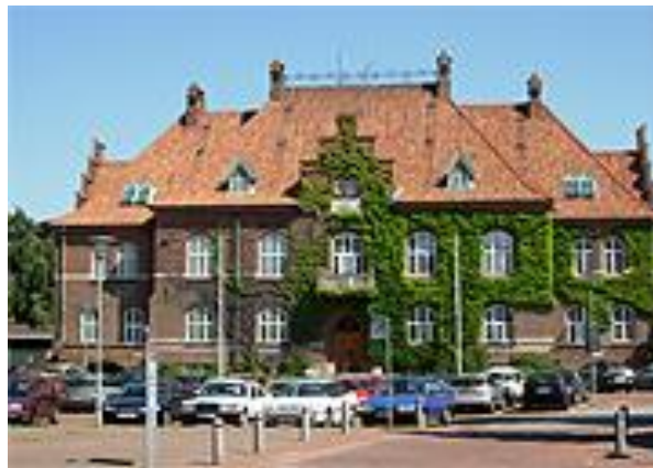
På det gamle Rådhus, Rådhusvej 1, 1. sal tv. - 4300 Holbæk